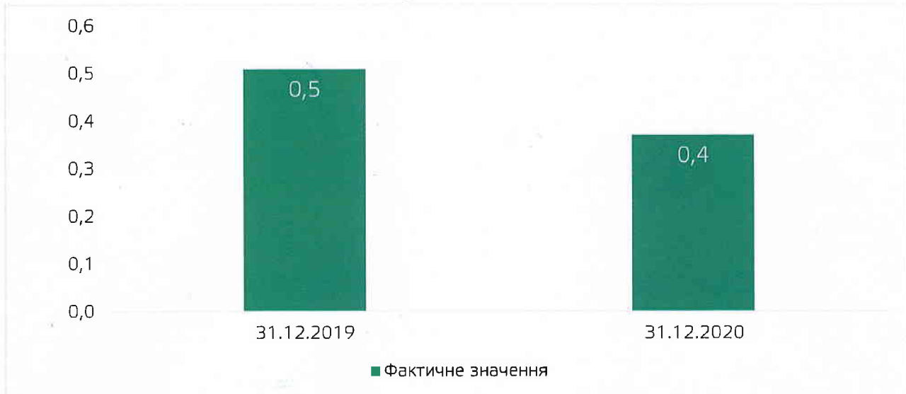
Рисунок 3.2. Коефіцієнт фінансової стійкості

Коефіцієнт фінансової стабільності – це індикатор фінансової стійкості, який говорить про здатність компанії відповідати за своїми зобов'язаннями в середньо- і довгостроковій перспективі. Значення показника вказує на те, скільки гривень власного капіталу припадає на кожну гривню зобов'язань компанії.