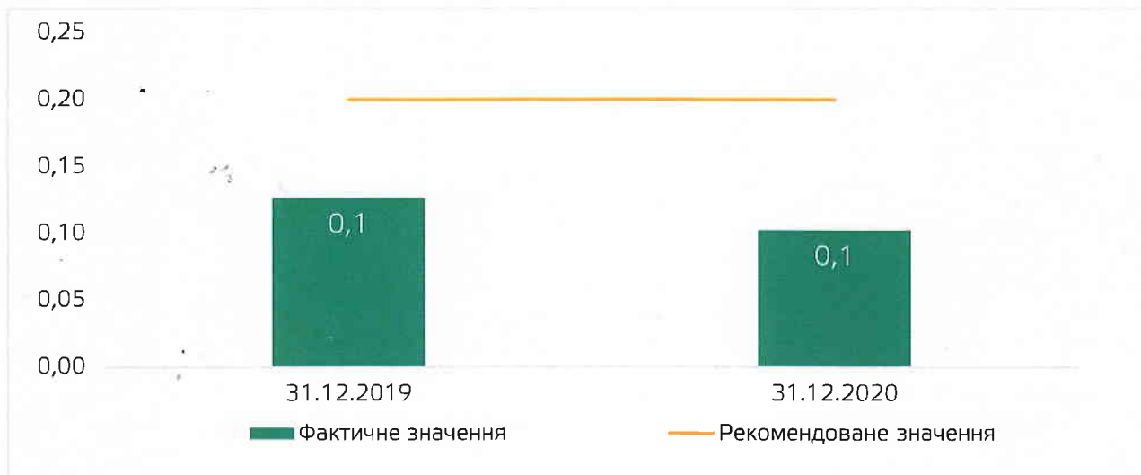
Рисунок 3.3. Коефіцієнт довгострокових зобов'язань

Коефіцієнт довгострокових зобов'язань характеризує частку довгострокових зобов'язань у загальній сумі джерел формування. Він показує, наскільки підприємство залежить від довгострокових зобов'язань в загальній сумі позикових коштів. Рекомендоване значення коефіцієнта менше 0,2.