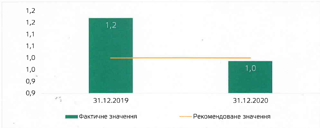
Рисунок 3.1. Коефіцієнт поточної ліквідності

Станом на 31.12.2020 р. значення коефіцієнта знаходиться в межах рекомендованого.