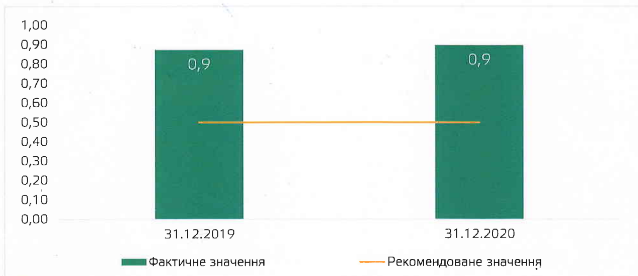
Рисунок 3.4. Коефіцієнт поточних зобов'язань

Коефіцієнт поточних зобов'язань характеризує питому вагу поточних зобов'язань в загальній сумі джерел формування. Він показує, наскільки підприємство залежить від поточних зобов'язань в загальній сумі позикового капіталу. Рекомендоване значення коефіцієнта більше 0,5.